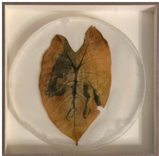
Almudena Romero, Hand on Wentii leaf EUR €1,500.00 Studies on my grandma's garden. The Act of Producing. The Pigment Change., 2022 20 x 20 cm.: Size framed