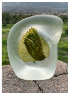
Almudena Romero , Hibiscus Sculpture. Studies on my grandma's garden. The Act of Producing. The Pigment Change. , 2023 Photograph printed on Hibiscus leaf Casted in bio resin fossil.