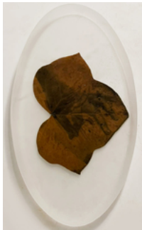
Almudena Romero, Hiedra hand oval EUR €2,500.00 Studies on my grandma's garden. The Act of Producing. The Pigment Change., 2023 Photograph printed on Hiedra leaf Casted in bio resin fossil. 15 x 30 cm.: Size unframed