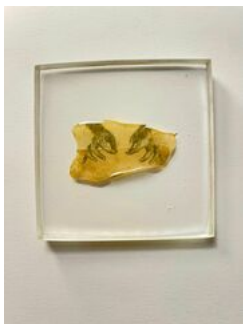
Almudena Romero , Sechium Blanco. The Pigment Change: The Act of Producing , 2023 Photograph printed on Sechium Blanco Casted in bio resin fossil.