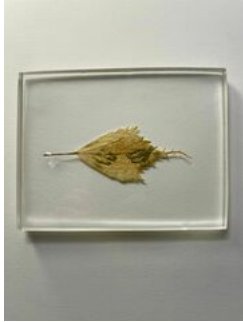
Almudena Romero , Rosa de Siria. The Pigment Change: The Act of Producing , 2023 Photograph printed on Rosa de Siria Casted in bio resin fossil.