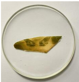
Almudena Romero , Azucena. The Pigment Change: The Act of Producing , 2023 Photograph printed on Azucena Casted in bio resin fossil.