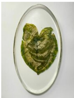
Almudena Romero , Taro Blanco. The Pigment Change: The Act of Producing , 2023 Photograph printed on Taro Blanco Casted in bio resin fossil.