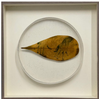
Almudena Romero, The Act of Producing, 2022 Photograph printed on leaves casted in bio resin fossil. 20 x 20 cm.