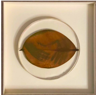
Almudena Romero, Hands on Ficus Studies on my grandma's EUR €1,500.00 garden. The Act of Producing. The Pigment Change., 2022 Photograph printed on Ficus leaf Casted in bio resin fossil. 20 x 20 cm.: Size framed