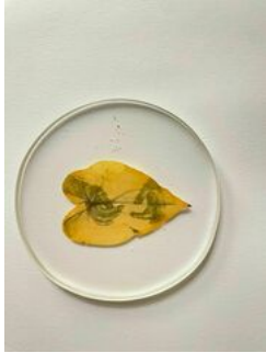
Almudena Romero , Cucullata Blanco. The Pigment Change: The act of Producing , 2023 Photograph printed on Cucullata Blanco Casted in bio resin fossil.