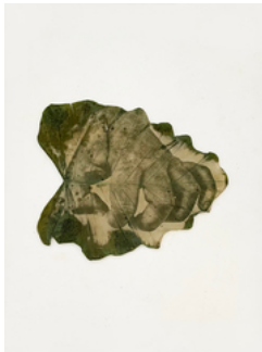
Almudena Romero, The Act of Producing, 2022 Photograph printed on leaves casted in bio resin fossil. 70 x 50 cm.