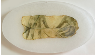
Almudena Romero, Hands on Taro Studies on my grandma's garden. EUR €2,500.00 The Act of Producing. The Pigment Change., 2022 Photograph printed on Taro leaf Casted in bio resin fossil. 30 x 15 cm.: Size unframed