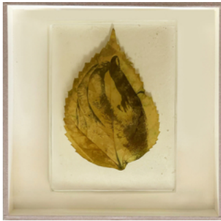
Almudena Romero, Hand on Hibiscus Studies on my grandma's garden. The Act of Producing. The Pigment Change., 2023 Photograph printed on Hibiscus leaf casted in bio resin fossil 20 x 20 cm.: Size Framed