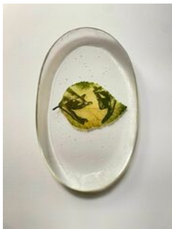
Almudena Romero , Hibiscus. The Pigment Change: The Act of Producing , 2023 Photograph printed on Hibiscus Casted in bio resin fossil.