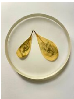
Almudena Romero , Pittosporum. The Pigment Change: The Act of Producing , 2023 Photograph printed on Pittosporum Casted in bio resin fossil.